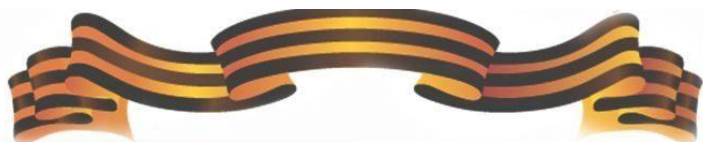
Журавлев Проконий ПАВЛОВИЧ