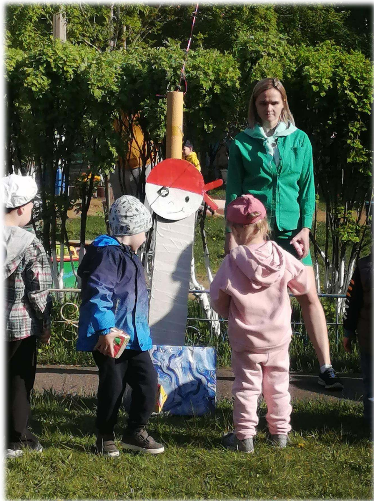
Дартс «Попади в пирата»