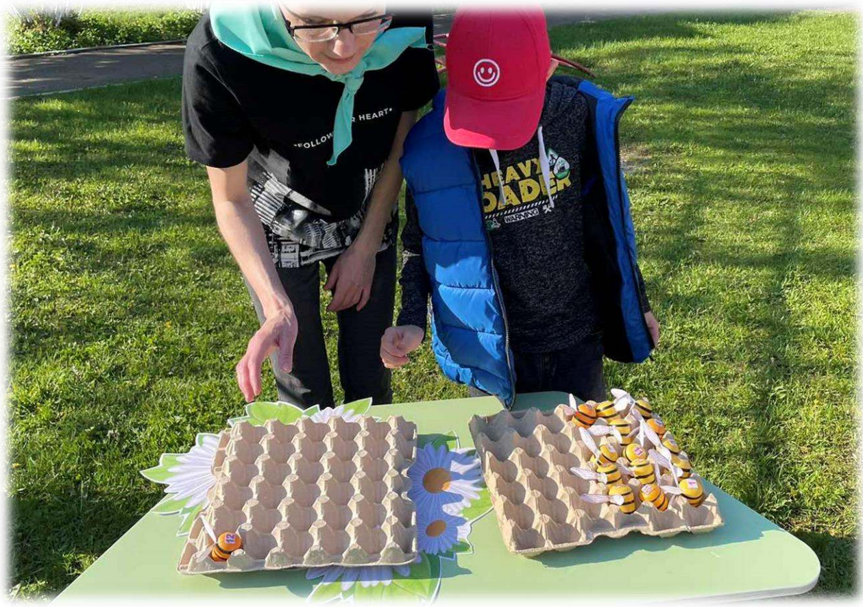
«Посели пчёлку в домик»