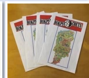
Буклеты, журналы своими руками