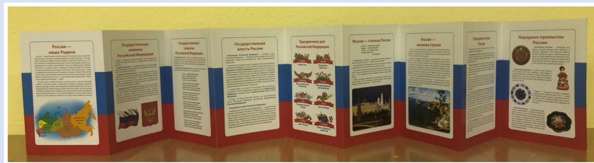
Папка-передвижка «Россия-наша Родина» информация для родителей