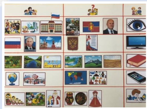
Модель «Метод трех вопросов»