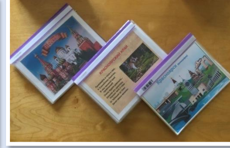
Методическая копилка «Страна, край, город» Фото, стихи, загадки