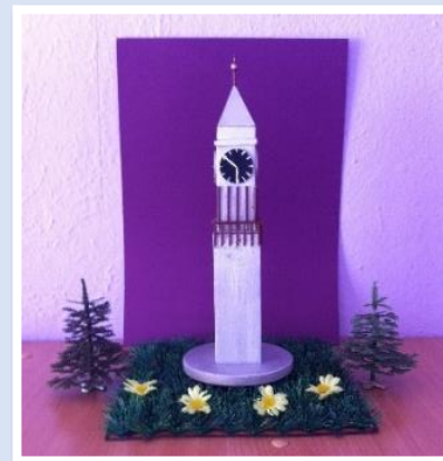
Главные часы города