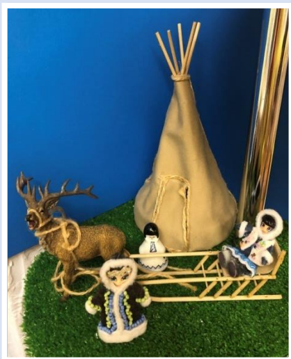
Коренные жители Севера