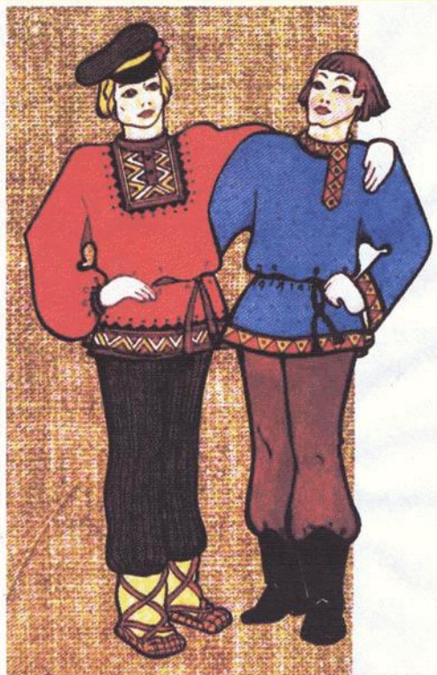
МУЖСКОЙ КРЕСТЬЯНСКИЙ КОСТЮМ (РУБАХА И ПОРТЫ)